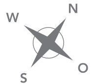
Illustration des Vorhabens. Abweichungen in einem späteren Planungsstadium bleiben ausdrücklich vorbehalten. Geringe Flächenabweichungen sind innerhalb eines Grundrisstyps möglich! Aufgrund technischer Erfordernisse können in Küchen, Bädern, WC's und Nebenräumen ggf. Teilbereiche abgeköffert und Decken abgehängt werden. Terrassen, Balkone und Loggien werden zu 50% angerechnet. Die eingezeichneten Möbel und Küchen sind nicht im Mietpreis enthalten. Die tatsächliche Verlegerichtung des Parketts kann von der im Plan angegebenen abweichen.